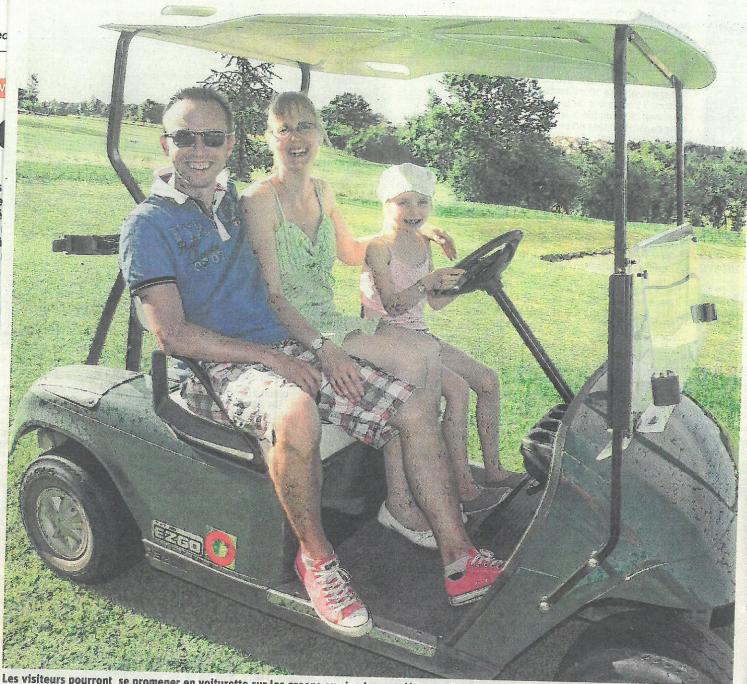
Les visiteurs pourront se promener en voiturette sur les greens ou simplement découvrir les lieux.

Le golf de Combles-en-Barrois, qualifié d'un des plus beaux 18 trous de la région, ouvre ses portes ce week-end. Initiation samedi et dimanche, encadrée par des bénévoles passionnés.