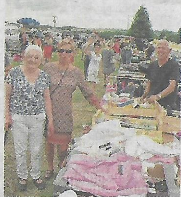
Forte affluence des visiteurs contrariée par des nuages menaçants.

Mais c'était sans compter sur les nuages menaçants en milieu d'après-midi qui ont aussitôt incité les vendeurs à remballer leurs marchandises tandis que les visiteurs se clairceraient.